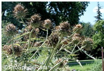
Le cardon « épineux argenté de Plainpalais »