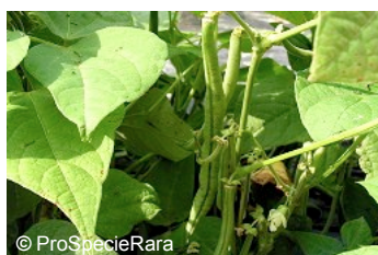
Le haricot nain « Marché des trois Chênes »