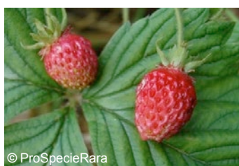
La fraise musquée « Capron royal »