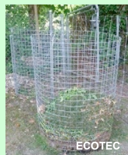
Compost commun dans un potager urbain.

✓ Déposer l'équivalent d'une brouette de compost (environ 0,1 m 3 ) pour 6 m 2 pour un sol pauvre, moitié moins pour un sol relativement riche. La quantité dépend également du type de culture.