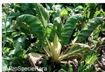
Le bette « Verte lisse de Genève »