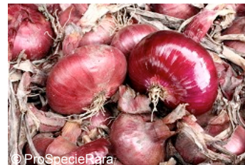
L'oignon « Rouge de Genève »