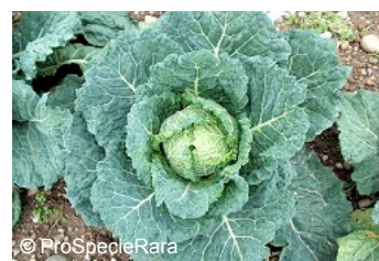
Le chou de Milan « à pied court de Plainpalais »